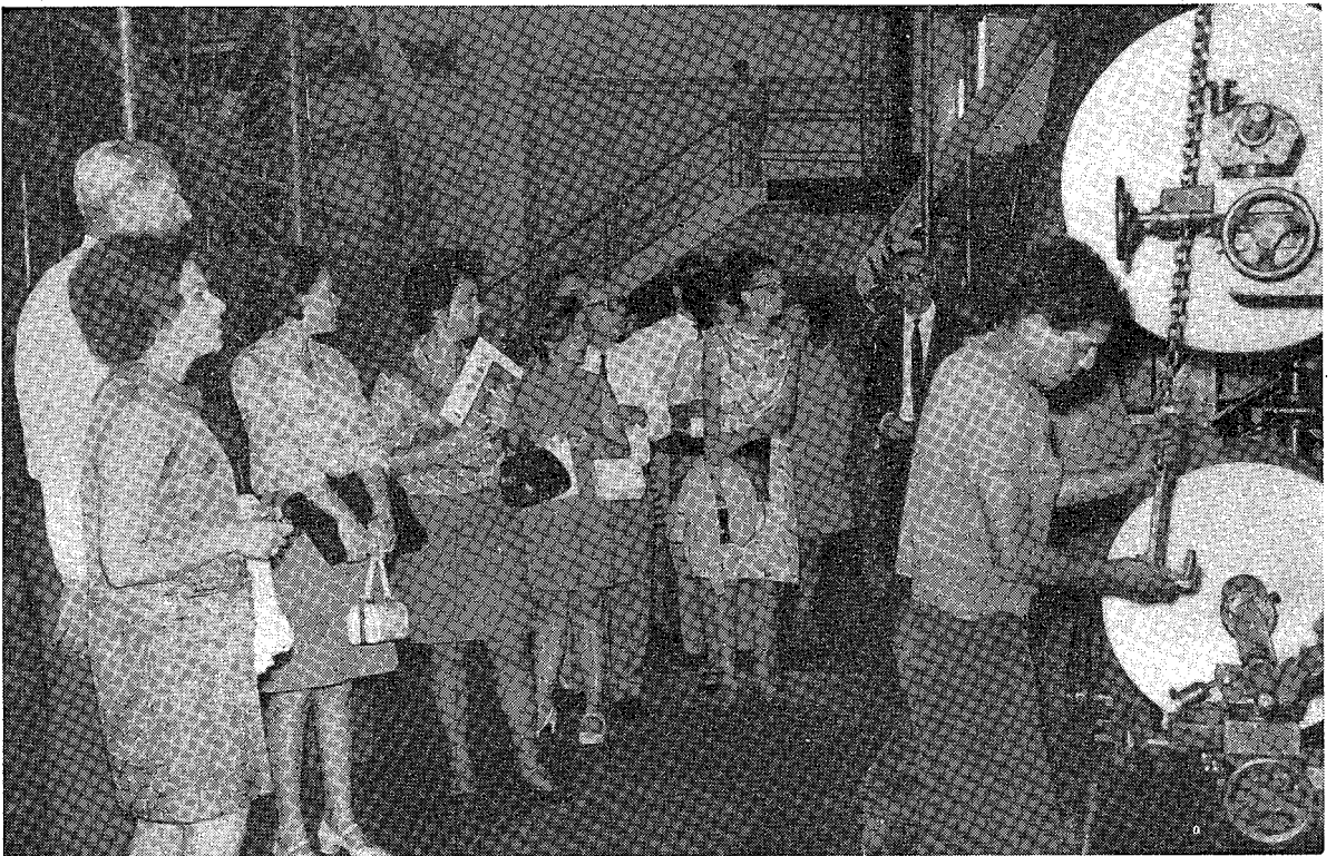
Dentro da intensa programação "II Semana de Estudos", constou interessantíssima visita ao parque industrial da Companhia Melhoramentos de São Paulo.