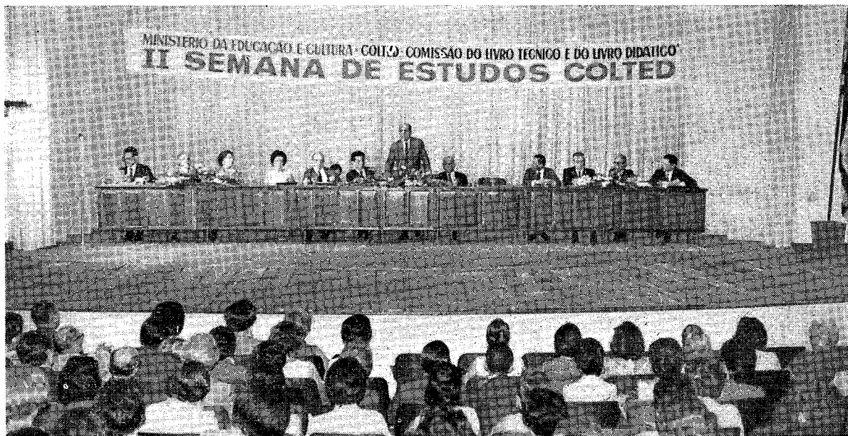
Aspecto da Mesa e de parte da assistência quando da sessão de instalação.